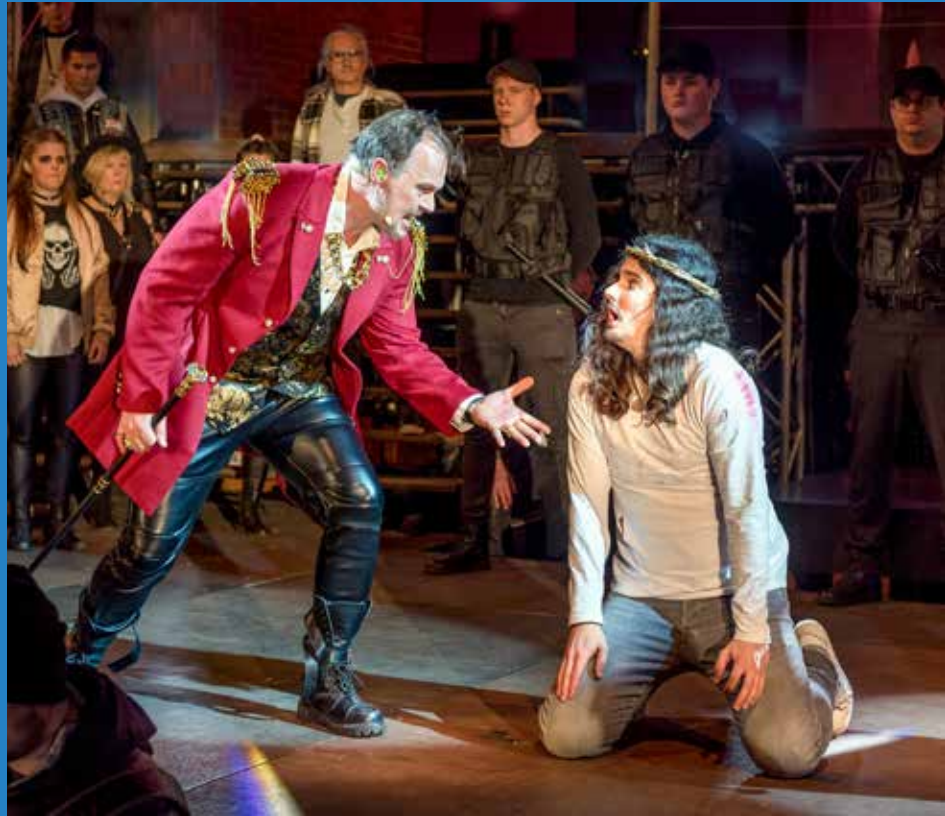
Jesus Christ Superstar, Foto: SJB-Timelkam

Redaktionsschluss für die nächsten Ausgaben